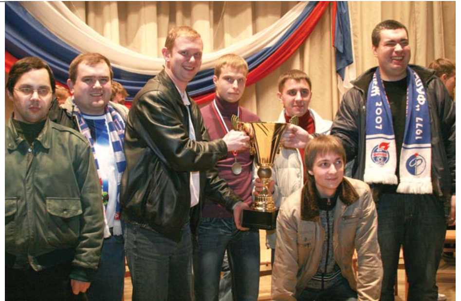
Предсезонная подготовка «Факела»